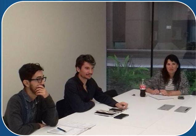
Trabajo de articulación Campus - Protocolo